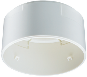
LRH1070/00 SENSR SURFACE BOX