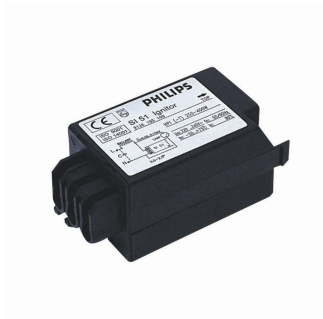
SN 58 T5